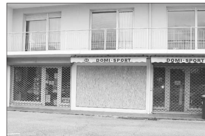
La vitrine a volé en éclats.

Victime : un magasin de sport du centre-ville. Préjudice : 30.000 €.