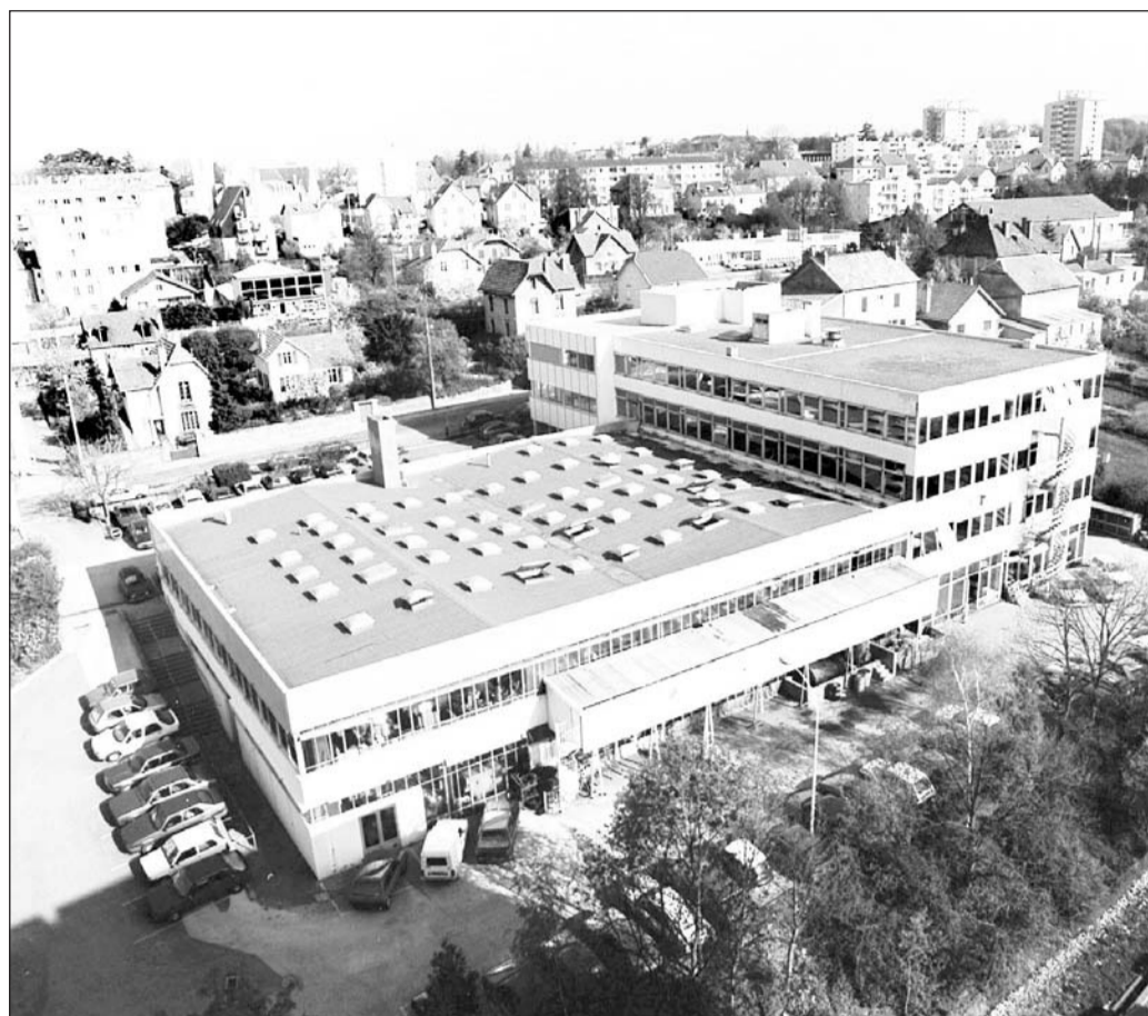
Micro-Mega est installée rue du Tunnel à Besançon. Le nouveau patron promet de garder ce site et son autonomie.

Cette entreprise présente des similitudes avec sa nouvelle « sœur » bisontine. Créée il y a un demi-siècle, elle est un peu plus grande, avec ses 350 salariés. Sa spécialité est à la fois proche et différente : la fabrication de moteurs et systèmes d'entraînement utilisés dans les tech-