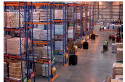
Les emplois des entrepôts sont exposés à l'automatisation

LES FACTEURS DE PÉNIBILITÉ RENCONTRÉS LORS DE NOS EXPERTISES se traduisent régulièrement par des TMS (troubles musculo-squelettique) et/ou RPS (risques psycho-sociaux). Il s'agit bien souvent de ports de charges couplés à des gestes répétitifs, à de la polyvalence accrue dans un contexte de sous-effectif chronique, à des rythmes de travail souvent soutenus, mais aussi à des horaires atypiques entraînant un accroissement du risque cardiovasculaire, des risques de troubles digestifs, des risques psychosociaux liés aux difficultés d'articuler vie de famille et professionnelle. Dans une certaine mesure, le recours à l'automatisation et la digitalisation permettent d'atténuer ces problèmes. Néanmoins, cette amélioration des conditions de travail peut s'accompagner d'une baisse des emplois, notamment en ce qui concerne le travail en entrepôt.