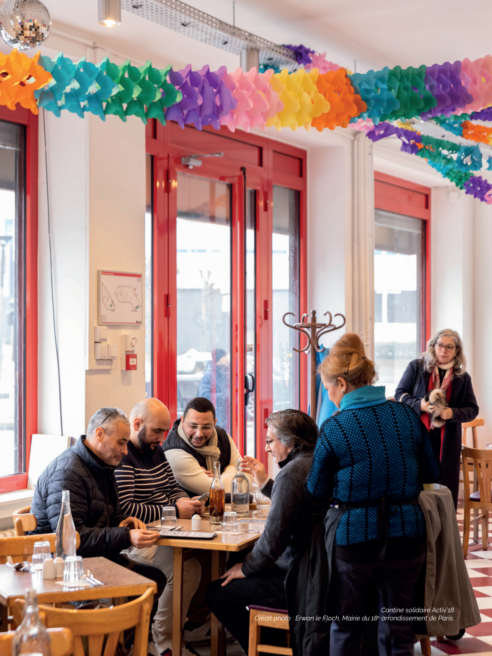
Cantine solidaire Activ'18