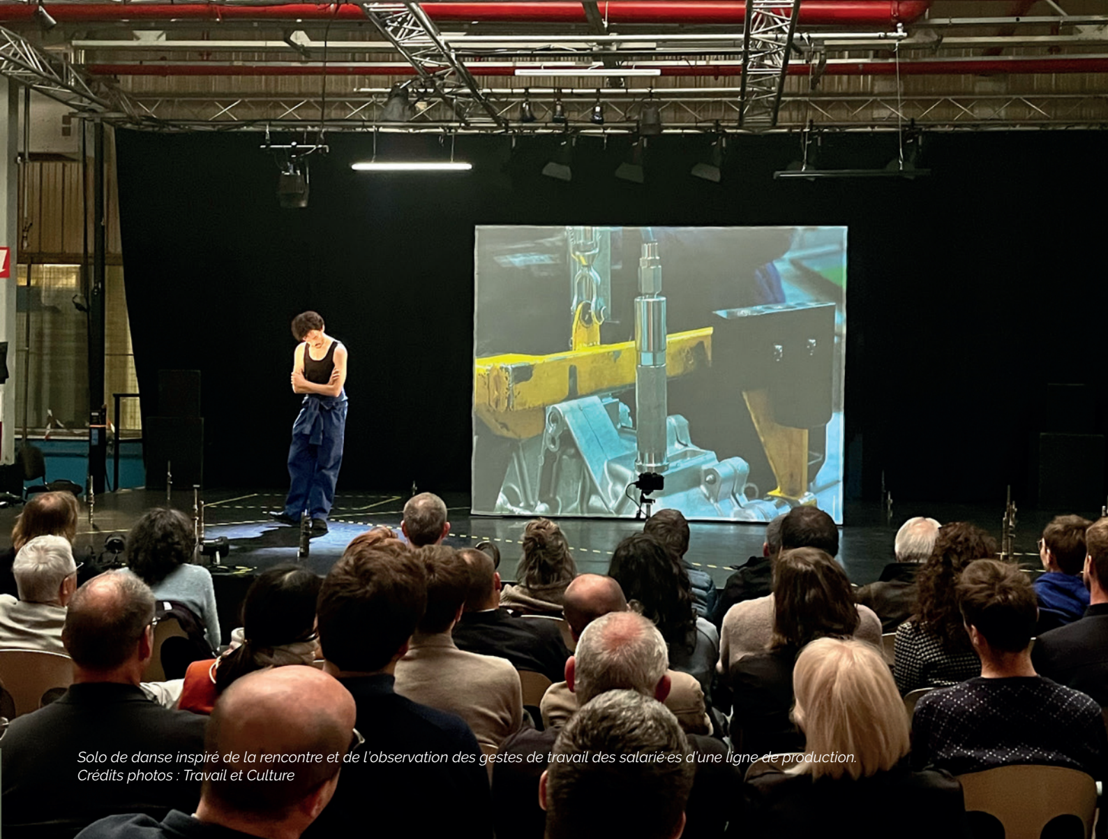
Solo de danse inspiré de la rencontre et de l'observation des gestes de travail des salarié-es d'une ligne de production.